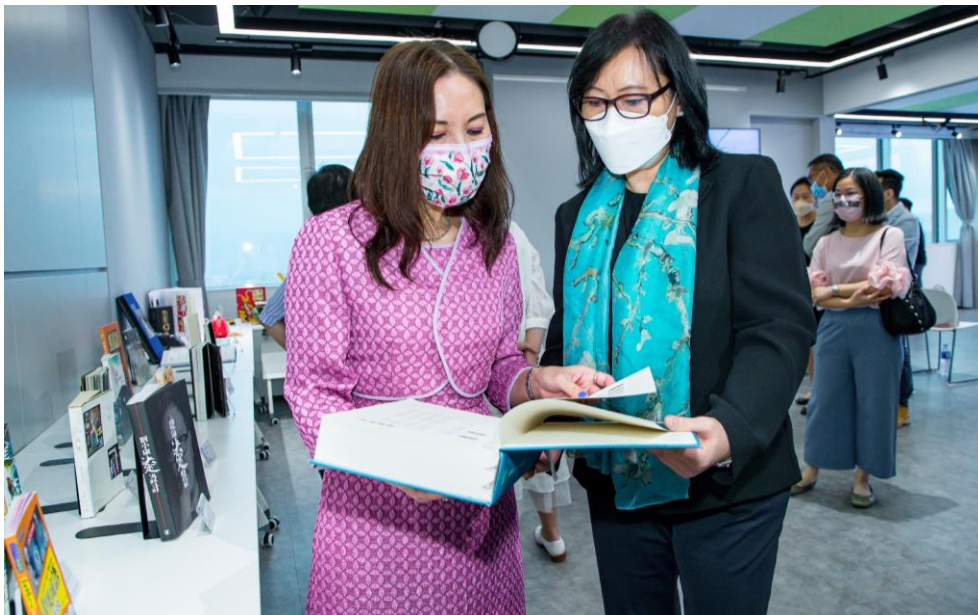
圖 5：來賓在揭幕禮上先睹為快，欣賞部分在「榮譽專區」展出的得獎出版物和印刷品。