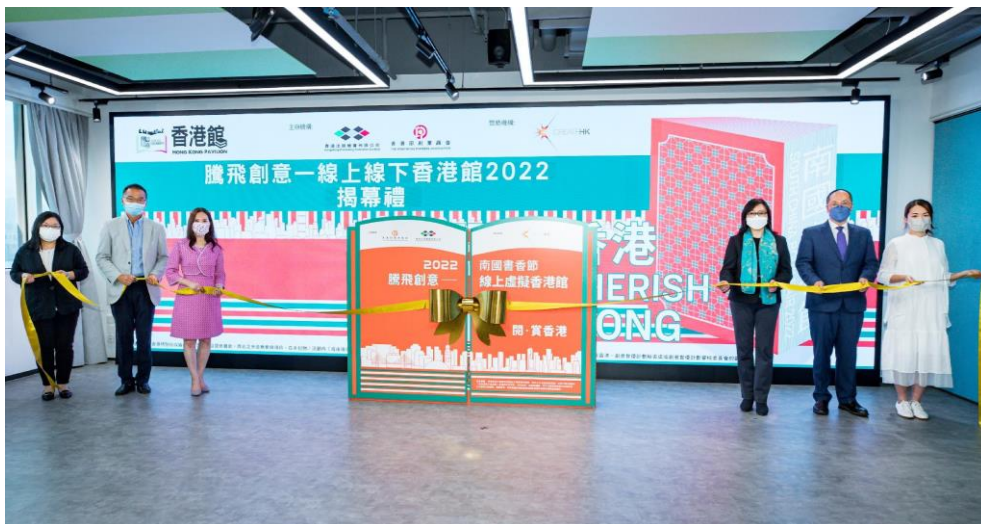
圖 4：一眾嘉賓為「南國書香節」「騰飛創意—線上線下香港館 2022」揭開序幕。