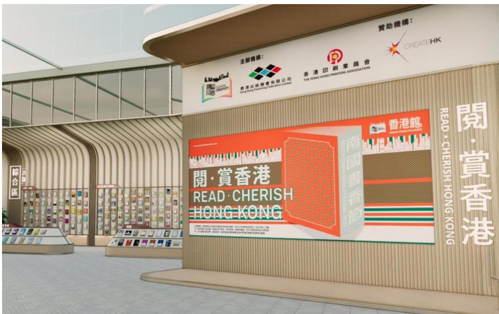
圖 6：虛擬「香港館」一隅。