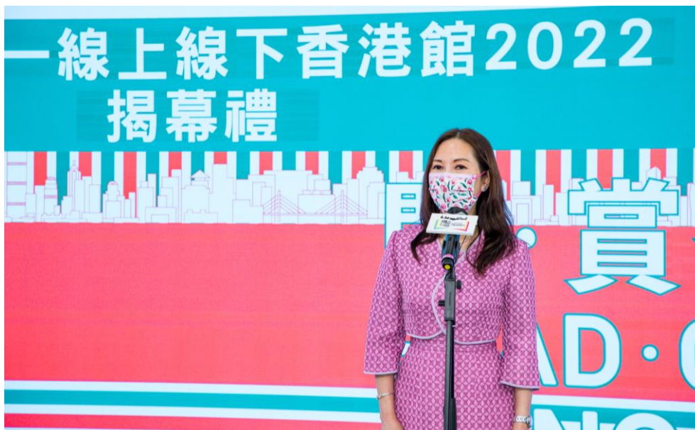
圖 2：香港特別行政區政府「創意香港」助理總監袁賽芳女士致辭時對「騰飛創意」項目表達肯定並祝願各參展商獲得豐碩成果。