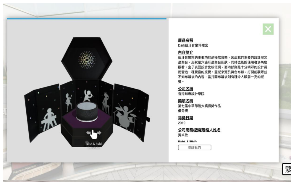
圖 7：利用立體掃描，虛擬「香港館」內的「榮譽專區」展品能夠以多角度細緻呈現精美設計。